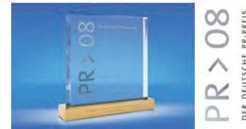
Ausgezeichnet mit dem Deutschen PR-Preis 2008